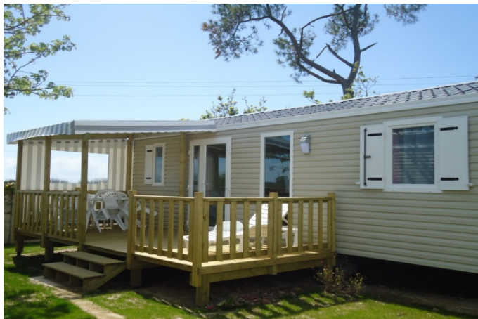
Vue extérieure du mobil'home