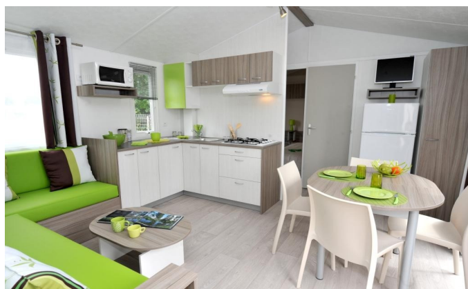
Pièce de vie côté cuisine