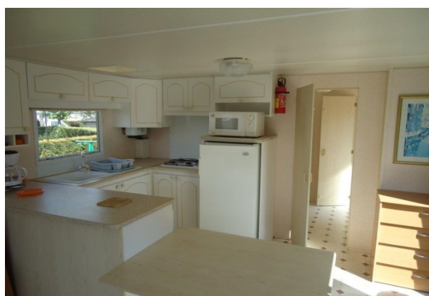
Pièce de vie côté cuisine