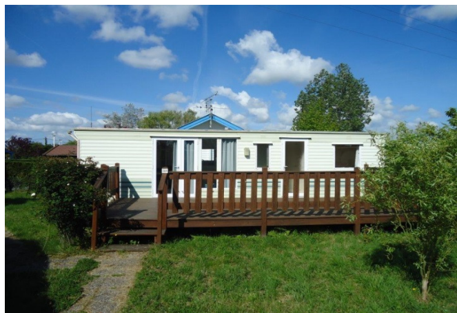
Vue extérieure du mobil'home