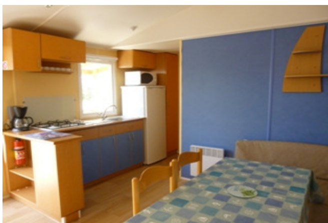
Pièce de vie côté cuisine