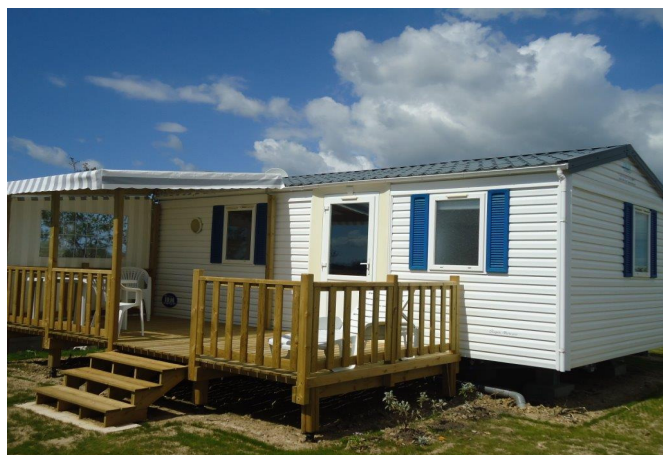
Vue extérieure du mobil'home